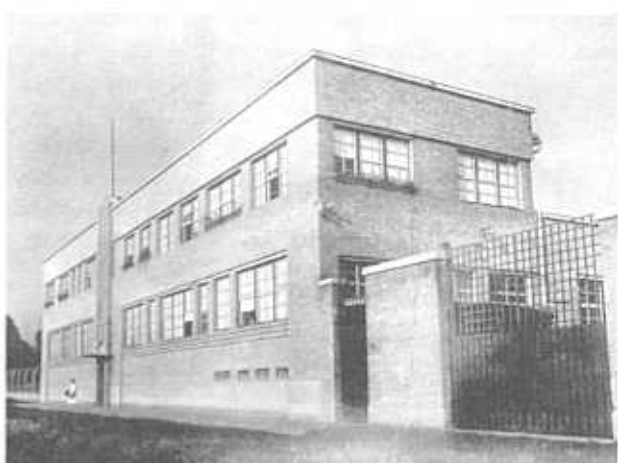
TREBITSCH FÉLE SELÉNYMGYÁR, SOPRON, 1925