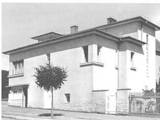
BETTELHEIM LIPÓT, LAKÓHÁZA, SOPRON, MIKOVINYI UTCA 22, 1932