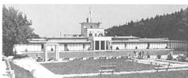
LÓVÉRI USZODA, SOPRON, 1934

1912-ben szerezte meg. 1914-ben házasított és bevonult katonának. Építész munkássága az első világháború befejezése után, 1918-ban indult. Az 1920-30-as években sorra készítette Sopron 20. század eleji városképét meghatározó, jelentős alkotásait. Ezek közül a következőket említnék ki. A Trebitsch-féle selémgvár és munkáslakások (1925), melyek megtervezését pályaza-