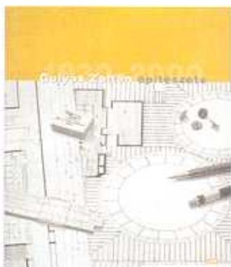
1. A könyv címlapja